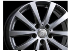
Team Sparco BALLARE