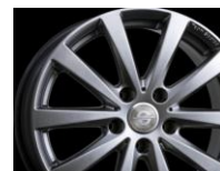
Team Sparco BALLARE