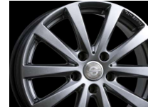
Team Sparco BALLARE